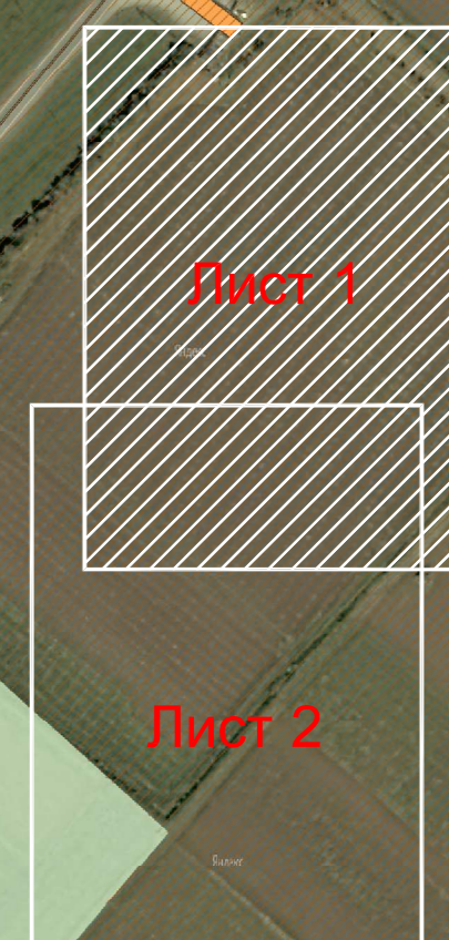
Схема совмещения листов